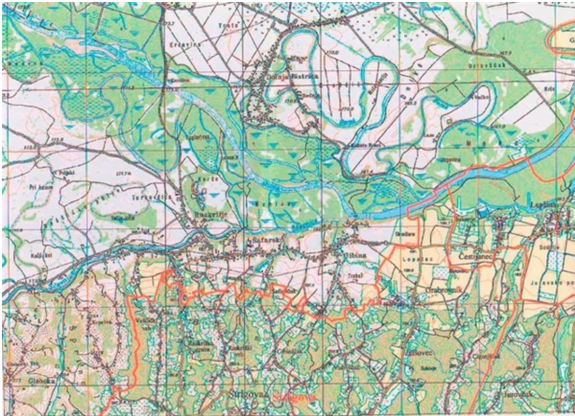
Karta broj 2 prikazuje granicu na području općine Sveti Martina na Muri (od Murišća do Marofa) te grada Mursko Središće (od Hlapišine do naselja Mursko Središće); (katastarske općine Sveti Martin, Hlapišina i Mursko Središće)